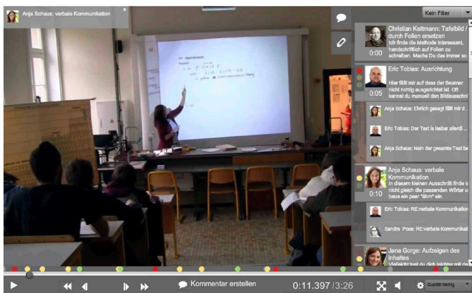
1. Anjas Video mit Peer-Kommentaren als Teil der Primärreflexion

Es werden das Einführungspraktikum (Studienbeginn), das Vertiefungspraktikum (Studienmitte), das Professionalisierungspraktikum (Endphase des Studiums) und das Referendariat im Berufsfeld als Untersuchungsbereiche genutzt, um den in allen am Projekt beteiligten Ländern sichtbaren grundsätzlich notwendigen systemischen Wandel in der Kooperation von Studierenden (Peers), Lehrenden und begleitenden Personen aus dem Berufsfeld für die Lehrer*innen/fortbildung zu verdeutlichen und diese notwendigen systemischen Veränderungen wirkungsvoll einzuleiten. Dafür entsteht auf der Basis von learning analytics ein Video- und Web-2.0-gestütztes Lehr- und Lernsystem, PrepareCampus , zur Förderung von Reflexionskompetenz, Lehrkompetenz und Wissens- bzw. Praxiserfahrungsaustausch. Ausgehend von kompetenzorientierten Beobachtungsschwerpunkten wird das digitale Lehr-/Lernsystem, bestehend aus einer Plattform für Video-Analysen und einer e-Portfolio-Anwendung, dazu genutzt, den Vollzug von Lehrkompetenzen im Unterricht im Spannungsfeld von Fachwissenschaft und -diaktik zu beobachten, zu analysieren und zu bewerten und letztlich über die Optimierung des beruflichen Handelns nachzudenken.