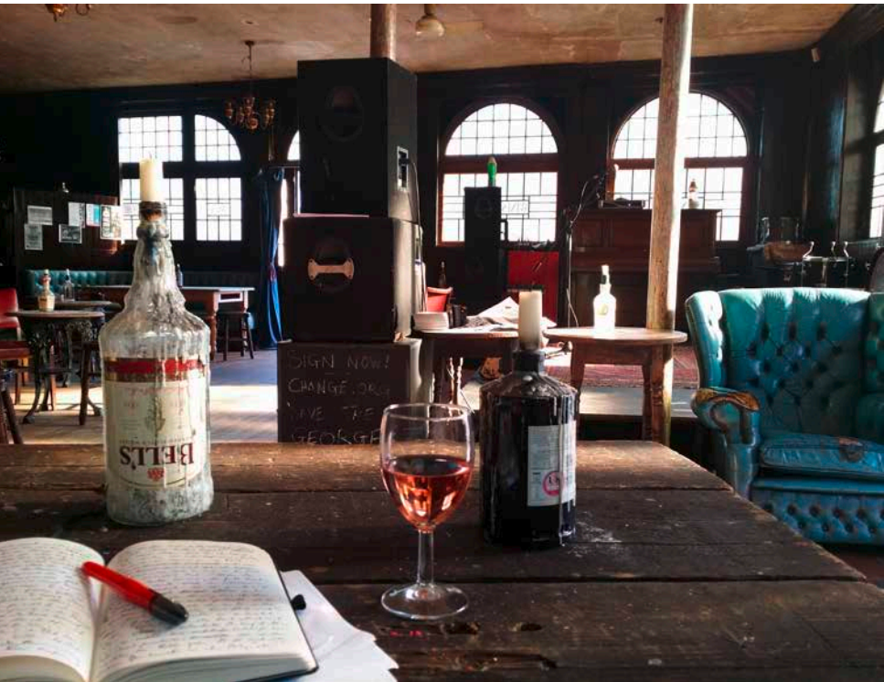
Ulrike Ulrich „George Tavern, London“

teilen wir uns in Kleingruppen auf und kochen unser eigenes Süppchen (20 Minuten) mittels Freewriting, Verse schmieden, Sprüche klopfen auf (Toiletten-) Papier, Wäscheleinen, nackter Haut und anderen Materialien. Am Ende kommen wir alle wieder zusammen, um zu schauen, was wir zum süßen Brei der Bedarfsbefriedigung durch Schreibberatung beitragen können (20 Minuten) – in der Hoffnung, dass uns die Sinne geöffnet wurden für eine wahrhaft HERZliche Wahrnehmung des Konferenzthemas im Verlaufe der SPTK 2016.